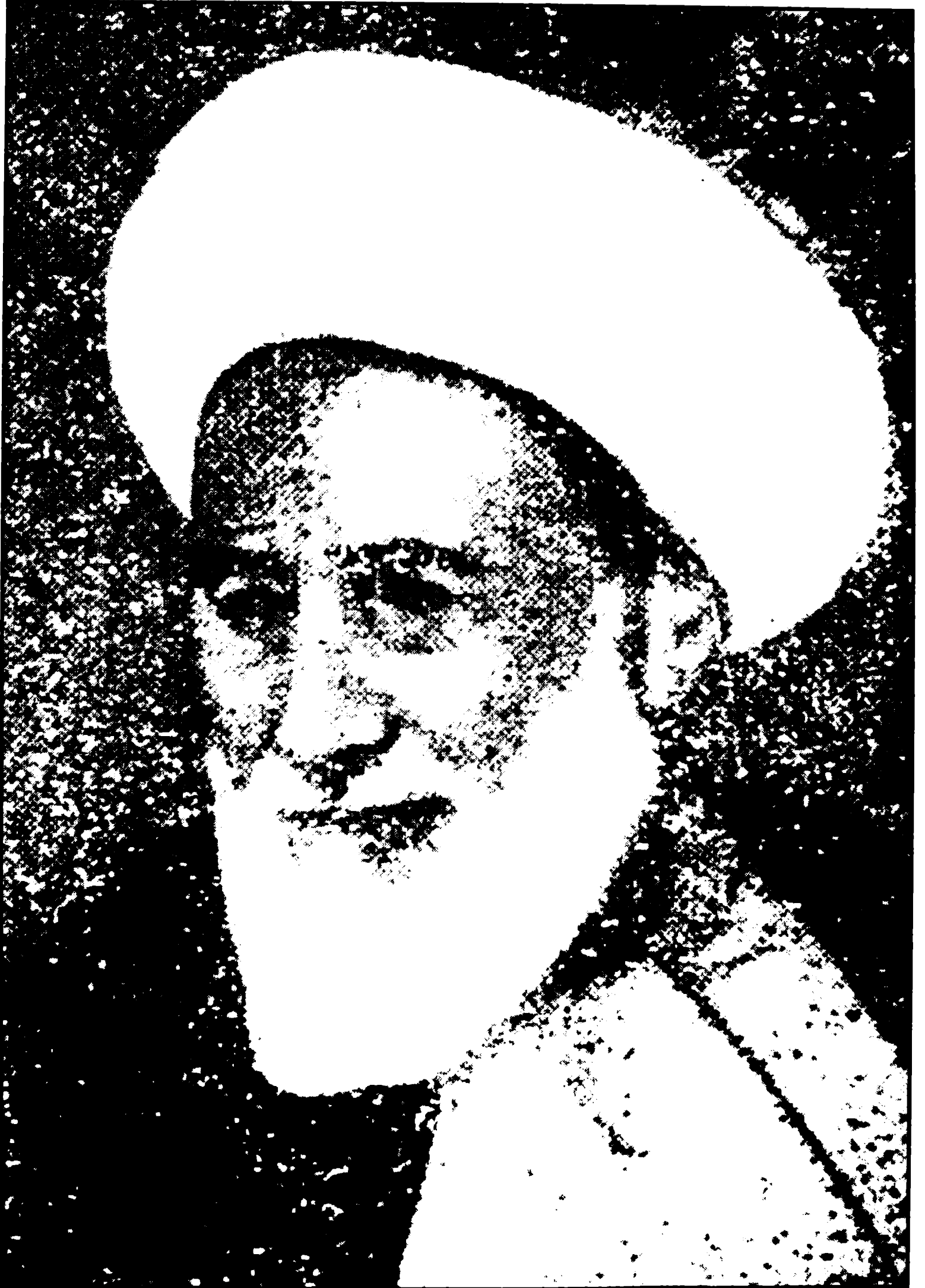
শাইখুল আযহার শেখ সালিম আল বিশরী